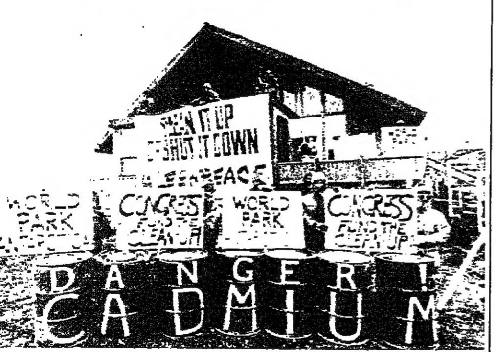
محتوياتها في مكان ما في المنطقة المتجمدة الجنوبية وجاءوا بها الى امام مكاتب المحطة الاميركية التي تسير على عملية التفريغ.